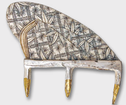
Brosche »Piano« Silber, Blattgold, Bein 2007