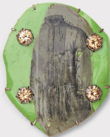
Brosche »In the Evening« Silber, Wellpappe, Kunststoff, synthetische Steine 2015