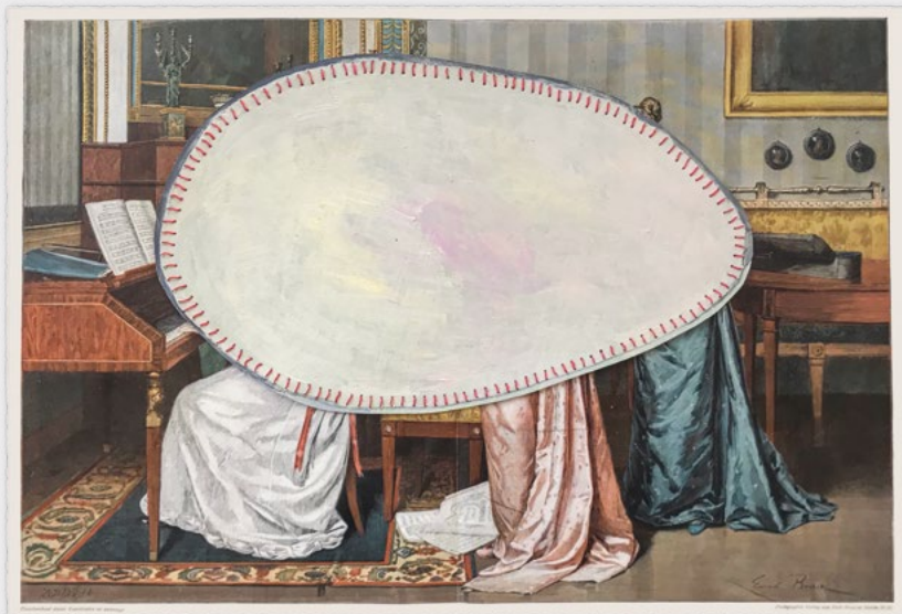
»The Blind Spot« Malerei, Collage 2020

Kunststoff, Amethyst, Prasiolith, Silber, Saphire Halle an der Saale, 2020